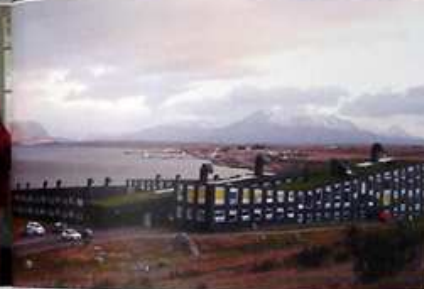
En medio de una caída de agua, se encuentran las Termas Geométricas, labradas en el Parque Nacional Villarica, por el camino a Coñardo. Abajo, uno de las últimas creaciones del arquitecto, el Hotel Perito, en Puerto Natales.

- ¿A qué se refiere con sobrepoblación arquitectónica? Lo que sucede es que cada vez que tenemos un espacio o un terreno, no se nos ocurre nada mejor que construir un edificio y sobrepoblar la zona. Pasa mi gusto, las ciudades de nuestro país no tienen por qué concentrarse, sino dispersarse, crear polos. La moda de hoy es comprar un departamento por seguridad o por muchas otras razones, pero una vez que lo habitan, de inmediato debes pensar dónde vas a salir, dónde jugarán tus niños. El vivo ejemplo de aprovechar más los espacios es lo que yo a ocurre con el aeropuerto de Cerillos, lleno de casas y edificios, cuando se pueden crear otro tipo de proyectos.